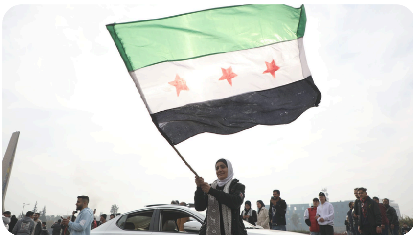
Paroles de N***, un requérant syrien en procédure d'appel

*UNHCR Dashboards & Factsheets - Situation reports on Samos 16/22 December 2024